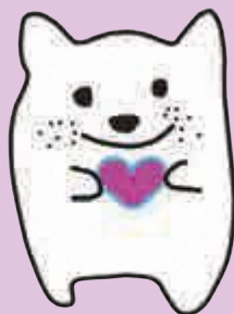
みんな大切な オンリーワン 京都府人権啓発キャラクター 「じんくん」